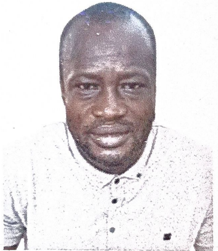
H45 x L35(mm)