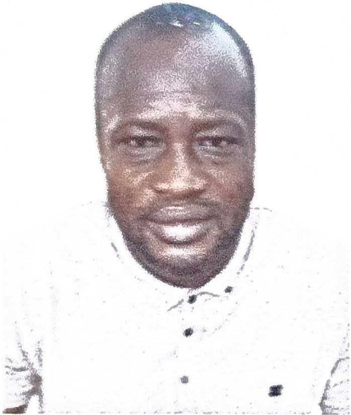
H45 x L35(mm)