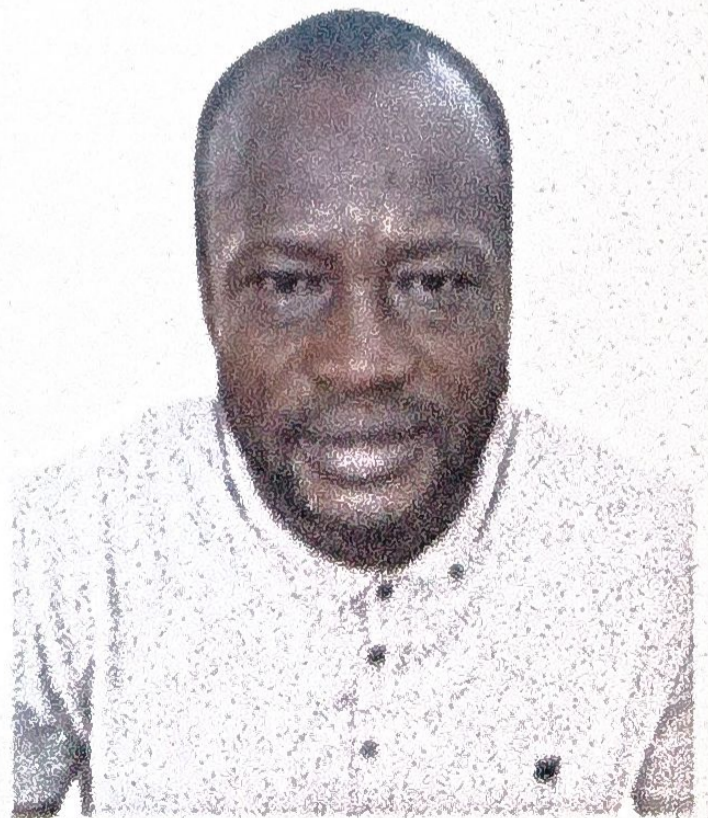
H45 x L35(mm)