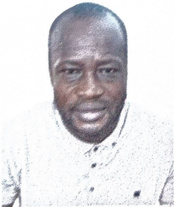
H45 x L35(mm)