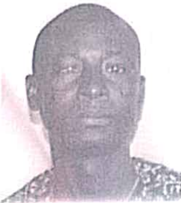
Signature / Signature